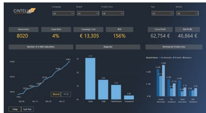
Beispiel E-Mail Response Reporting